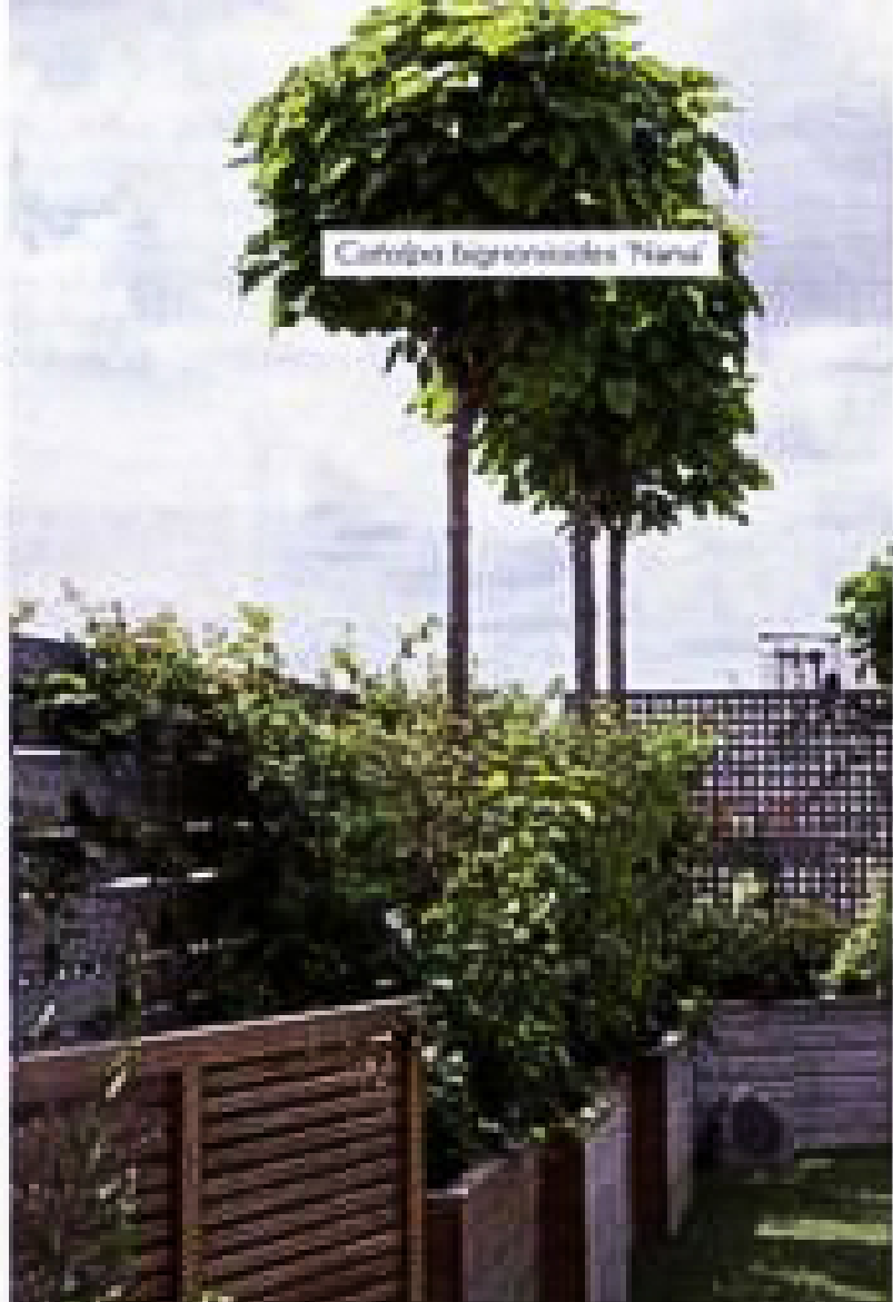
Cornus bignonioides 'Mona'