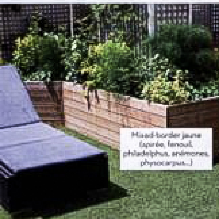
Mixed-border jeune (sparte, fenouil, philadelphus, anémone, physocarpus...)

À Pétage, l'ambiance jardin est donnée par une frange pelouse, tellement douce et propre que l'on peut s'y promener pieds nus. Les bacs en inox rinçés sur place sont laissés naturels, sans laque ni peinture, pour mieux s'accorder avec les mixed borders d'allure champêtre. Ces derniers, composés de plantes vivaces et de petits arbustes adaptés aux terrasses, s'appuient sur des cloches rebâties en inox également et dont les hauteurs varient pour conserver la vue sur Paris.